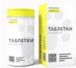
ВЕТ ПРЕПАРАТЫ 01.10.2024