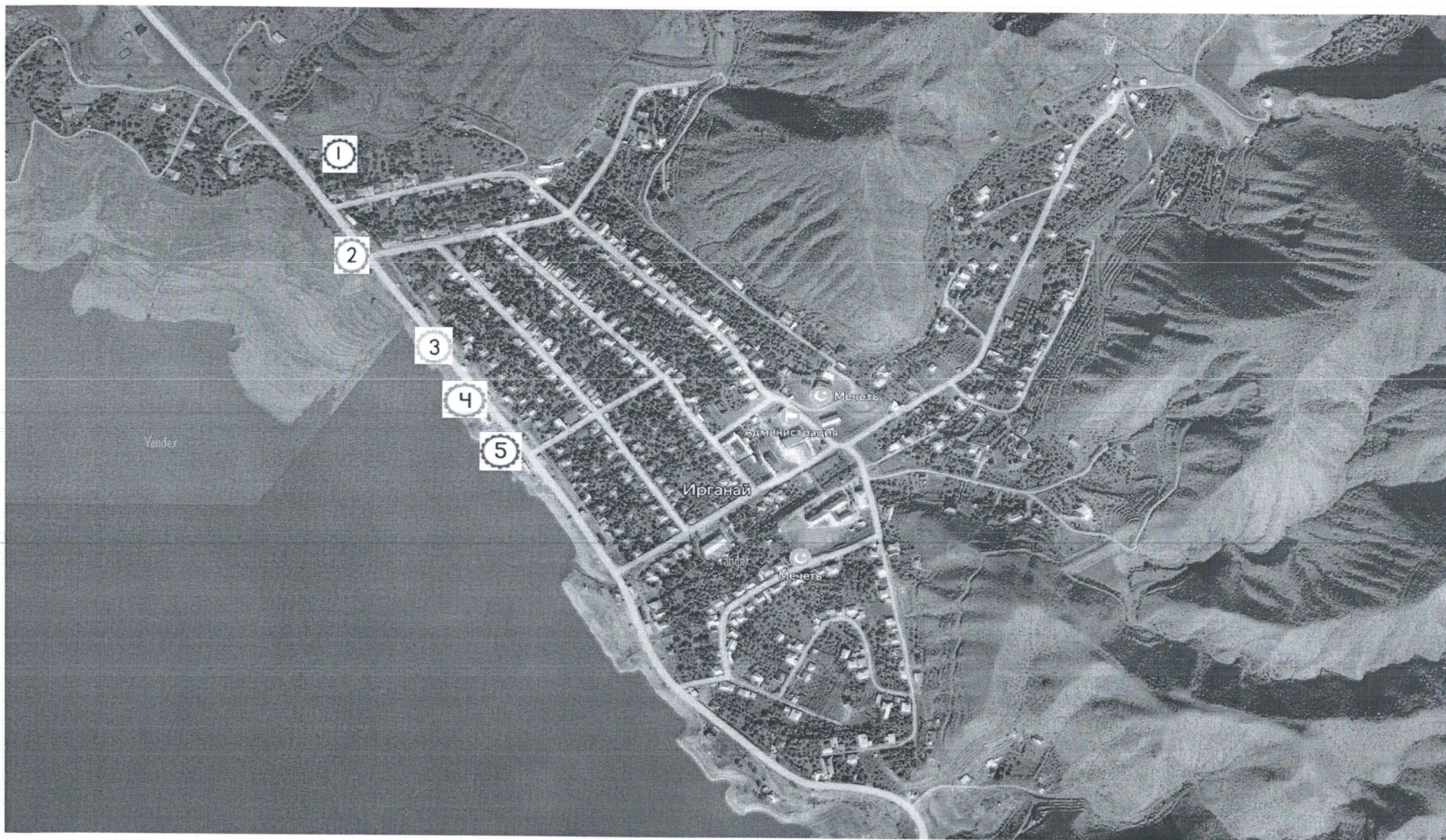
Схема (графическая часть) размещения нестационарных торговых объектов на территории МО «Унцукульский район»: сел. Ирганай