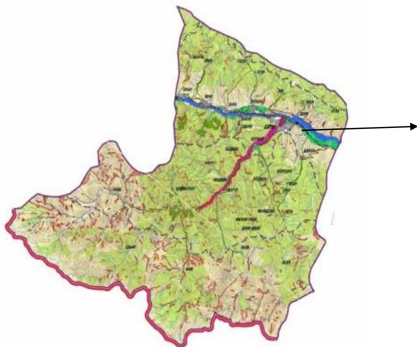
СХЕМА (графическая часть) размещения нестационарных торговых объектов на территории СП «сельсовет Ахтынский» по состоянию на 01 ноября 2021 года