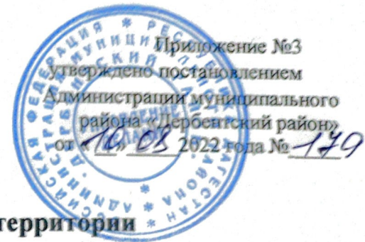
Схема размещения нестационарных объектов потребительского рынка на территории Муниципального района «Дербентский район» - с.Геджух парк им.Кирова